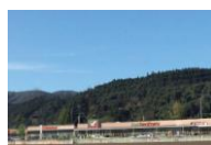
フォレストモール仙台茂庭