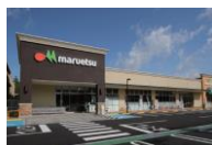
フォレストモール印西牧の原