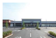
フォレストモール甲斐竜王