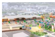
フォレストモール岩出