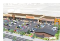
フォレストモール佐久平