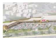
フォレストモール京田辺

● 全ての催事場は屋外にございます。 ● 会場のご予約はお申込み日の翌月末まで承っております。また抽選申込期間と一般申込期間を設けております。(抽選申込期間) 毎月第1月曜日から当週の金曜日までに、上述の「お問い合わせフォーム」またはお電話・メール等でお申込みください。翌週の火曜日を目的地に担当者より結果をお知らせ致します。(一般申込期間) 抽選申込期間以降、会場に空きがある場合にご予約を承らせて頂きます。 ● 備品(机・椅子他)は施主様にてお持ち込みください。 ● 備品の事前発送等の受付(現地でお受取り・保管)は致しかねます。施設内店舗でも対応致しかねますので当日にご持参ください。 ● 発生したごみは全て施主様にてお持ち帰りください。 ● 施設内に店舗している店舗で取り扱いのある商品や類似する商品を取り扱う場合は、ご出店をお断りさせて頂く場合がございます。またそれ以外の場合でも当施設に相応しくないと弊社にて判断した場合は、ご出店をお断りさせて頂く場合がございます。 ● 「催事出店申込書」及び「催事場使用確認書」記載事項に違反した場合、会場使用許可を取り消させていただきます。尚、使用許可取消に伴う損害等については、弊社は一切の責任を負いません。