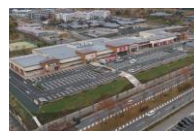
フォレストモール木津川

●全ての催事場は屋外にございます。●会場のご予約はお申込み日の翌月末まで承っております。また抽選申込期間と一般申込期間を設けております。(抽選申込期間) 毎月第1月曜日から当週の金曜日までに、上述の「お問い合わせフォーム」またはお電話・メール等でお申込みください。翌週の火曜日を目途に担当者より結果をお知らせ致します。(一般申込期間) 抽選申込期間以降、会場に空きがある場合にご予約を承らせて頂きます。●備品(机・椅子他)は施主様にてお持ち込みください。●備品の事前発送等の受付(現地でお受取り・保管)は致しかねます。施設内店舗でも対応致しかねますので当日にご持参ください。●発生したごみは全て施主様にてお持ち帰りください。●施設内に出店している店舗で取り扱いのある商品や類似する商品を取り扱う場合は、ご出店をお断りさせて頂く場合がございます。またそれ以外の場合でも当施設に相応しくないと弊社にて判断した場合は、ご出店をお断りさせて頂く場合がございます。●「催事出店申込書」及び「催事場使用確認書」記載事項に違反した場合、会場使用許可を取り消させていただきます。尚、使用許可取消に伴う損害等については、弊社は一切の責任を負いません。