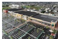
フォレストモール石岡