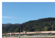
フォレストモール仙台茂庭