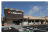
フォレストモール印西牧の原