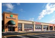
フォレストモール岡谷