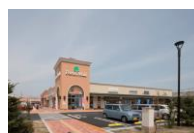
フォレストモール新前橋