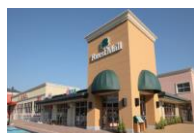
フォレストモール富士河口湖