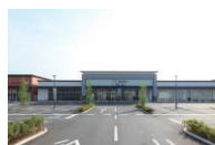
フォレストモール甲斐竜王