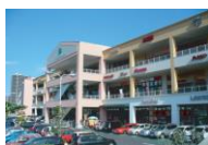
フォレストモール南大沢

全国のフォレストモールで催事スペースをご用意しております。(施設名をクリックしてご参照ください。)